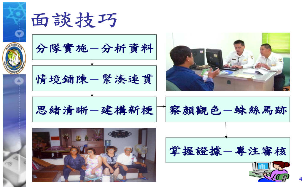
圖 4-4-1：專勤隊實施面談技巧

客體，依「面談管理辦法」第 3 條及第 4 條第 3 項規定，申請進入臺灣地區團聚、居留或定居之大陸地區人民及其臺灣地區配偶或親屬，均為移民署實施面談之客體。